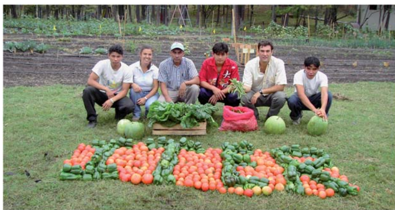
▲ Equipo de agricultura al completo

En Honduras pudimos ver y constatar la predisposición natural de los niños hacia el cultivo de hortalizas: disfrutaban preparando la tierra, sembrando, regando y cuidando de sus plantas. Para muchos de ellos es una extraordinaria manera de ocupar su tiempo de ocio o tedio, de una forma entretenida y divertida, además de resultar productiva.