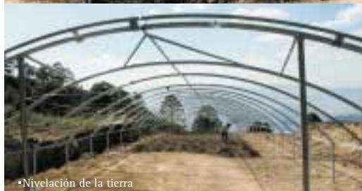
•Nivelación de la tierra