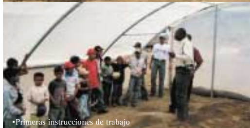
•Primeras instrucciones de trabajo