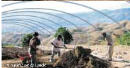
•Preparación del suelo