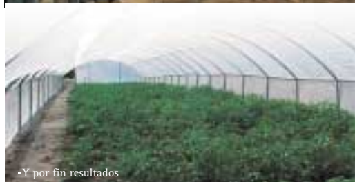
•Y por fin resultados

las afueras de Tegucigalpa. De esta forma, se resolvían las deficiencias de suministro de agua en épocas de sequía.