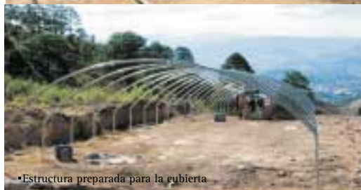
•Estructura preparada para la cubierta