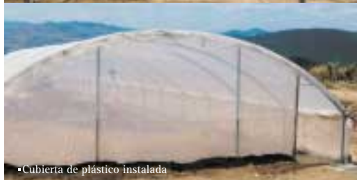
•Cubierta de plástico instalada