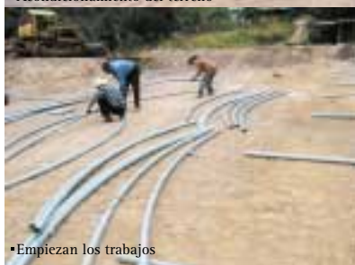
•Empiezan los trabajos

Lo más difícil era encontrar a una contraparte que comulgara con nuestros principios, fieles a la misión de brindar oportunidades para el goce de una vida plena a los niños que viven en condiciones difíciles en barrios populares de la capital, Tegucigalpa. En este sentido “Compartir” se adhería exactamente a nuestros propósitos en su apuesta por el protagonismo comunitario