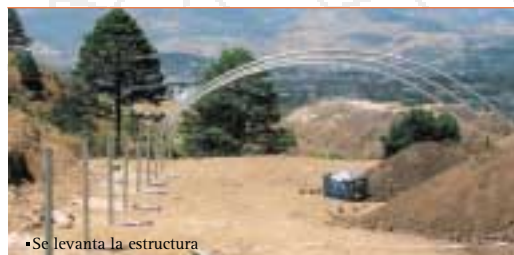
•Se levanta la estructura