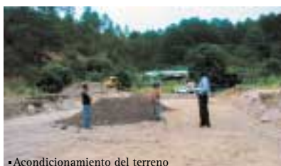
•Acondicionamiento del terreno

Acabamos de terminar el proyecto emprendido el pasado año junto a la Asociación Compartir. Más que finalizar, es ahora cuando empieza todo: los niños tienen hoy la oportunidad de participar en un proyecto agrícola, aprender a regar y cuidar la tierra y los cultivos e incluso vender luego la producción.